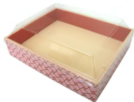
別注提案品 原反名:P組木(ベージュ)赤 本体: 173×141×35(29)