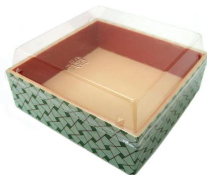
別注提案品 原反名:G組木(ベージュ)赤 本体: 132×132×42(35)