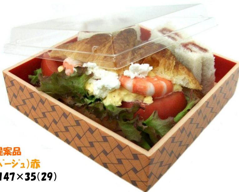
別注提案品 原反名:組木(ベージュ)赤 本体: 147×147×35(29)